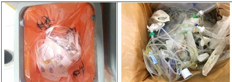
일반 폐기물(단순 링거백 등)이 의료폐기물로 배출