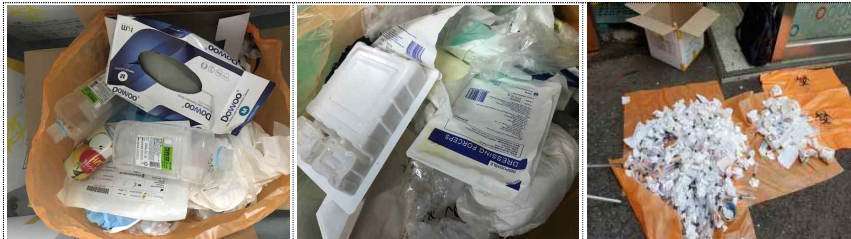
☞ 일반폐기물로 배출될 수 있는 포장재, 종이류, 플라스틱류 등이 의료폐기물로 혼합 배출